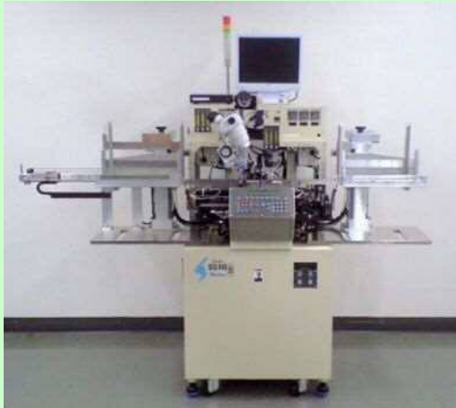
長尺基板対応(個片搬送)