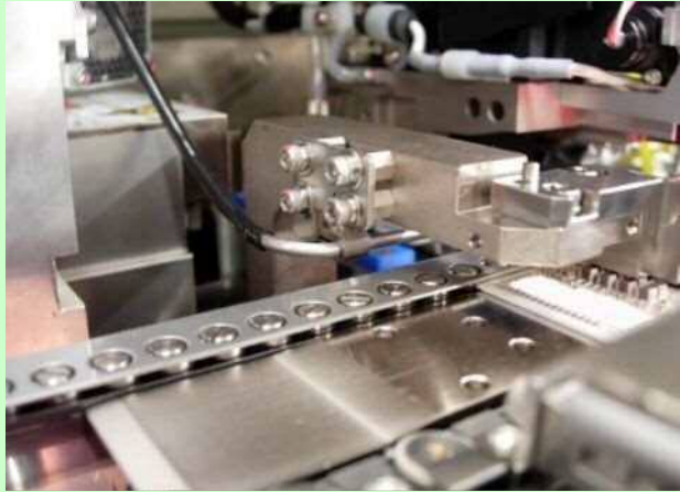
短式工作片(单片流片)