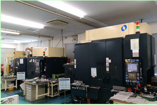
マシニングセンタ