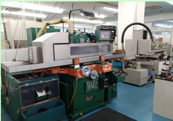
超精密NC平面研削機・精密平面研削盤