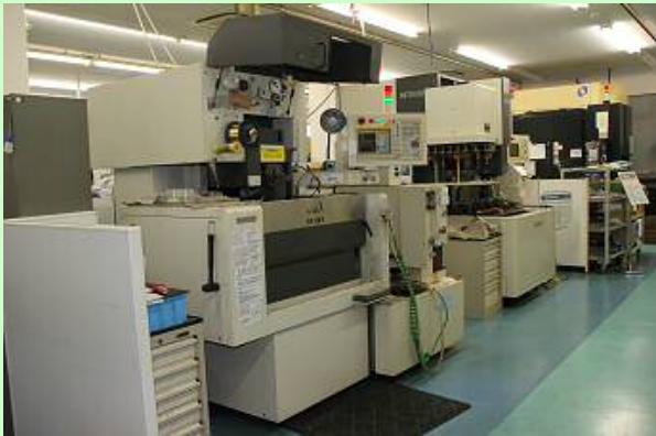
ワイヤ放電加工機・型彫り放電加工機