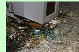
ワイヤ放電加工技術