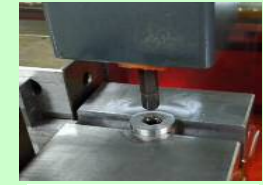
型彫り放電加工技術