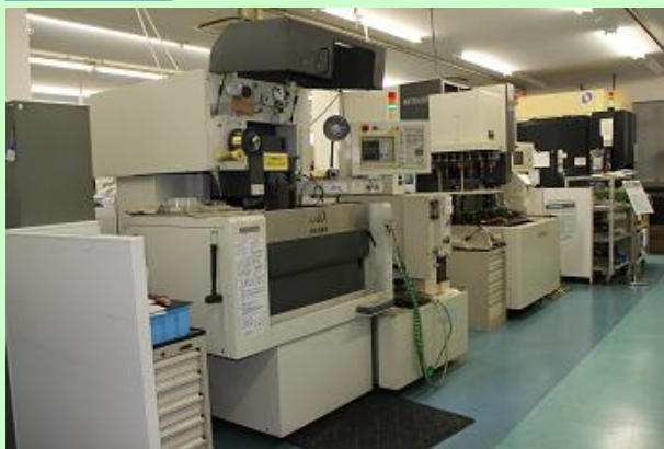
电火花线切割机·模雕电火花机