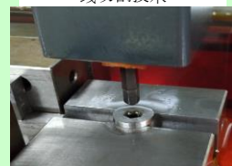
模具电火花加工技术