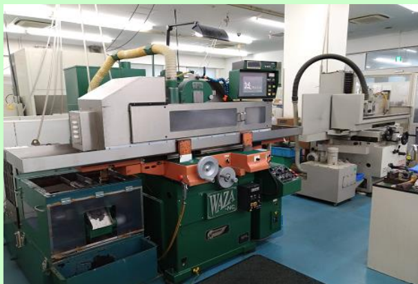
超精密数控曲面磨床·精密平面磨床